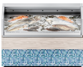
Aanpasbare beplating en materialen