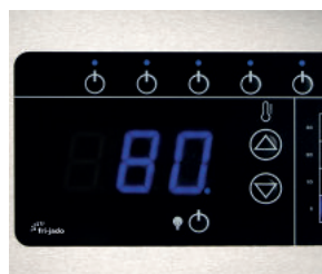
Bedieningspaneel van Premium