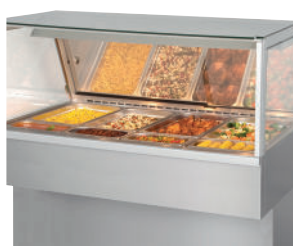
Hot Deli 4 Square Full-Serve