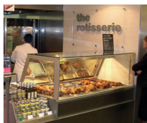
Hot Deli Square