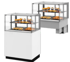
Vloermodel of drop-in versie