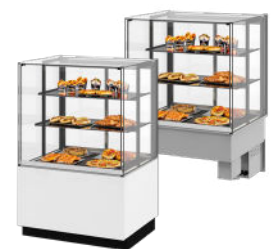
Vloermodel of drop-in versie