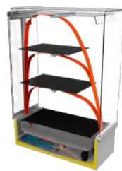
Gepatenteerde Hot Blanket-bewaartechnologie