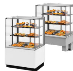
Vloermodel of drop-in versie