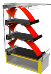
Gepatenteerde Hot Blanket-bewaartechnologie