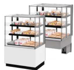
Vloermodel of drop-in versie