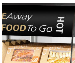
Gebruik van borden