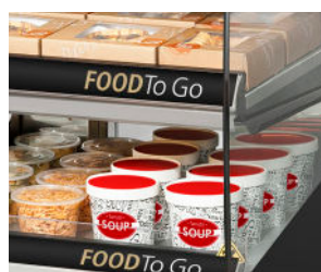
Optimaal zicht op producten