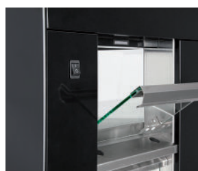
Deuren aan achterzijde (optioneel)