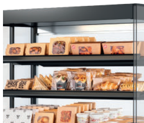
Voedsel (letterlijk) in de spotlights - Ledverlichting boven elk schap.