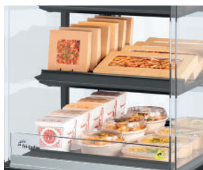
Ultieme productzichtbaarheid - transparant ontwerp, dunne schappen, geen afleiding.