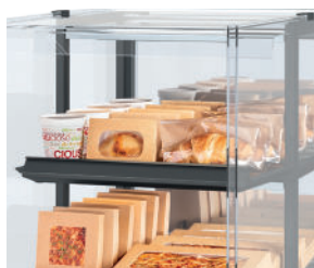
Voedsel (letterlijk) in de spotlights - Ledverlichting boven elk schap.