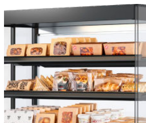
Voedsel (letterlijk) in de spotlights - Ledverlichting boven elk schap.