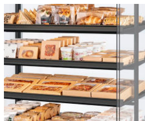
Ultieme productzichtbaarheid - transparant ontwerp, dunne schappen, geen afleiding.