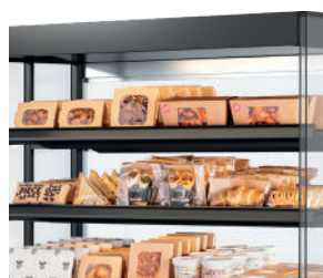
Voedsel (letterlijk) in de spotlights - Ledverlichting boven elk schap.