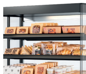
Voedsel (letterlijk) in de spotlights - Ledverlichting boven elk schap.