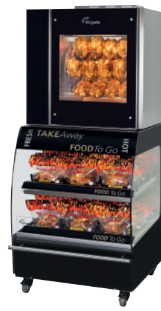
Space Saver TDR5 P

De Fri-Jado Space Saver is een uitstekend voorbeeld van effectief gebruik van vloeroppervlak. Door een TDR 5-rotisserie en een MDS 86-2 meubel voor zelfbediening te combineren, kunt u waardevol vloeroppervlak besparen.