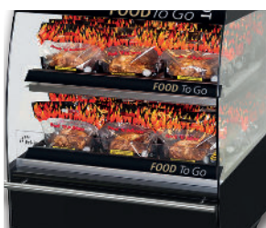
MDS 86-2 self serve

* raadpleeg de afzonderlijke specificatiebladen voor meer informatie over de rotisseries met 4 en 5 pitten