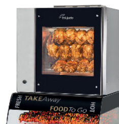
Space Saver TDR5 M