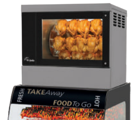
Space Saver TG 4