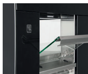
Deuren aan achterzijde