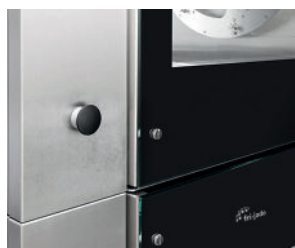
Draaiknop aan de klantzijde