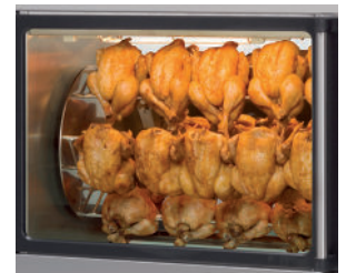
Veel zicht op het product